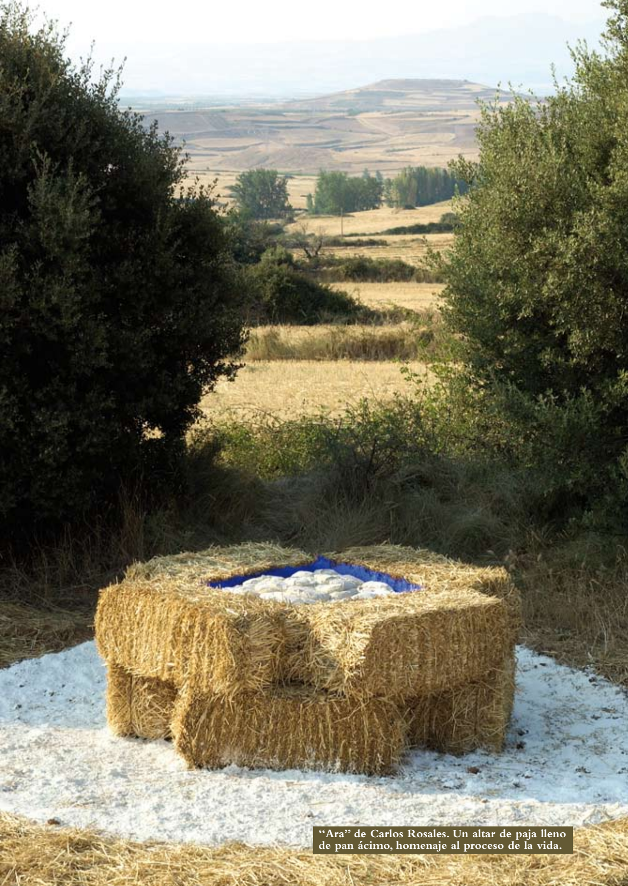
“Ara” de Carlos Rosales. Un altar de paja lleno de pan ácimo, homenaje al proceso de la vida.