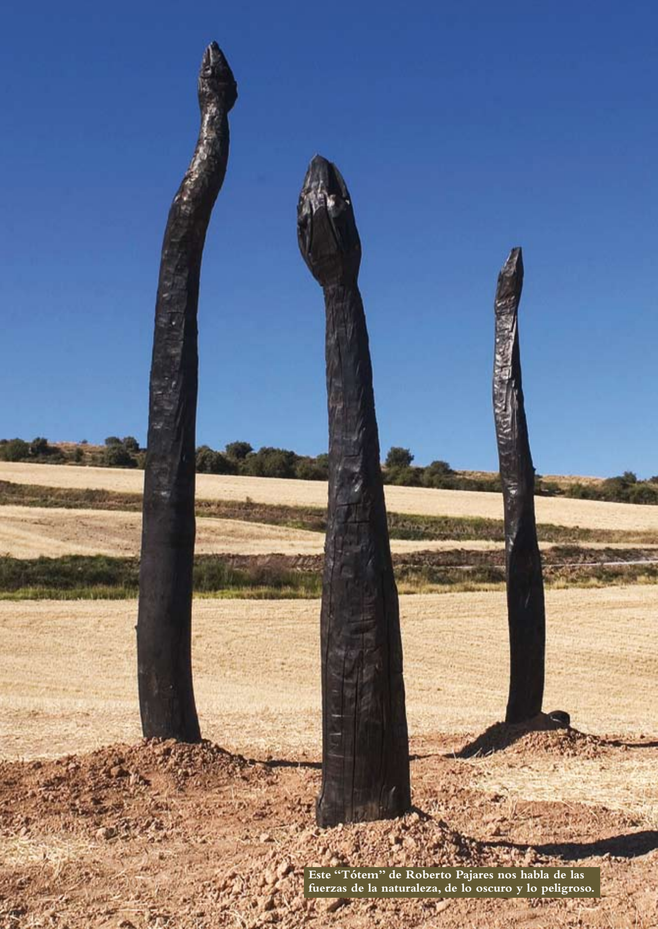
Este "Tótem" de Roberto Pajares nos habla de las fuerzas de la naturaleza, de lo oscuro y lo peligroso.