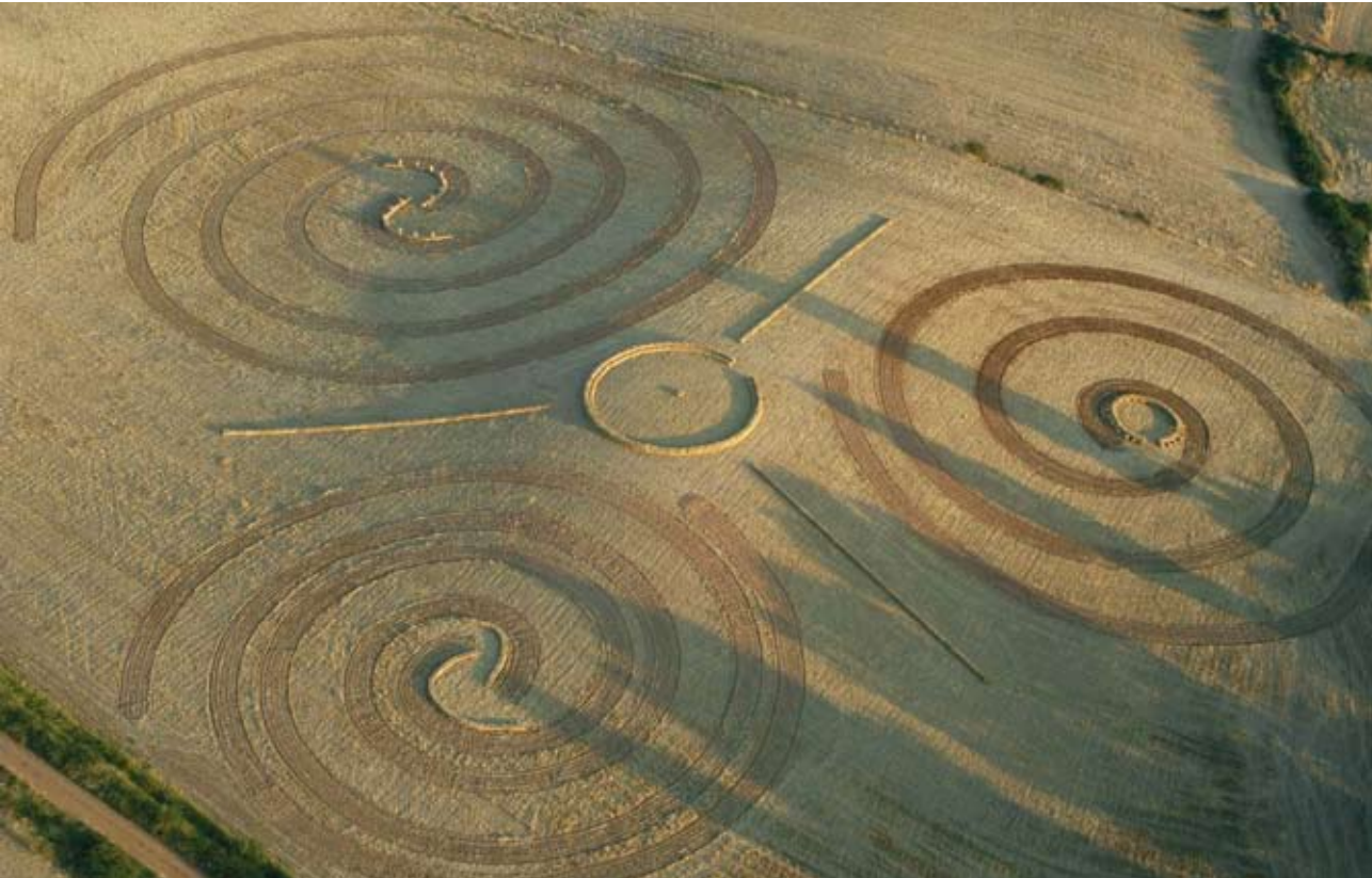
“Vueltas y vueltas” de Demetrio Navaridas es una invitación a entrar en la era, un espacio de encuentro.

El land art no es una manifestación artística tan extraña como pueda parecernos en un principio. Se trata del arte de la tierra ¿Acaso alguien puede resistirse a pisar la nieve recién caída, dejando un dibujo de huellas, un rastro de pisadas, como lo hace el pincel en un lienzo en blanco? Estas obras responden al impulso natural del hombre de participar de su entorno, a relacionarse con él. Son producto del diálogo que naturaleza y artista mantienen.