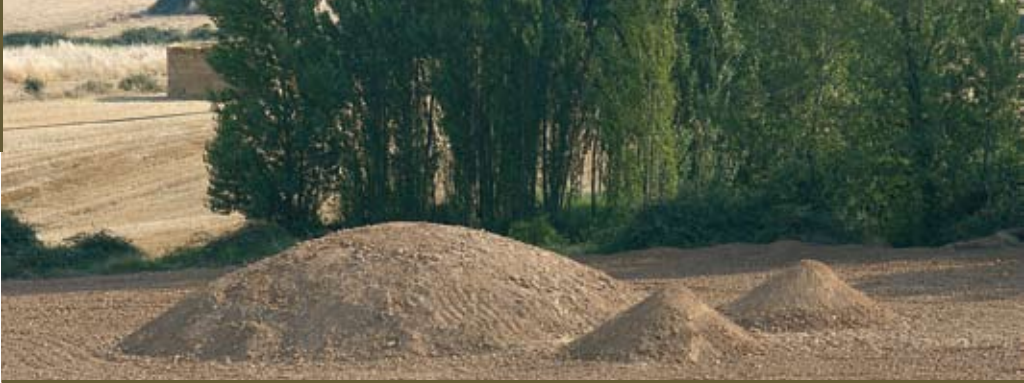
“Embarazada” de Blanca Navas es poesía visual. La tierra fértil en la que se gesta la vida.

pero a su vez, como féretro que alberga la muerte (calavera). Carmelo Argáiz en su obra “Eleguás” habla del camino, del tránsito entre una vida natural y otra más superficial.