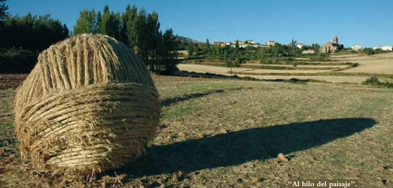
“Al hilo del paisaje”.