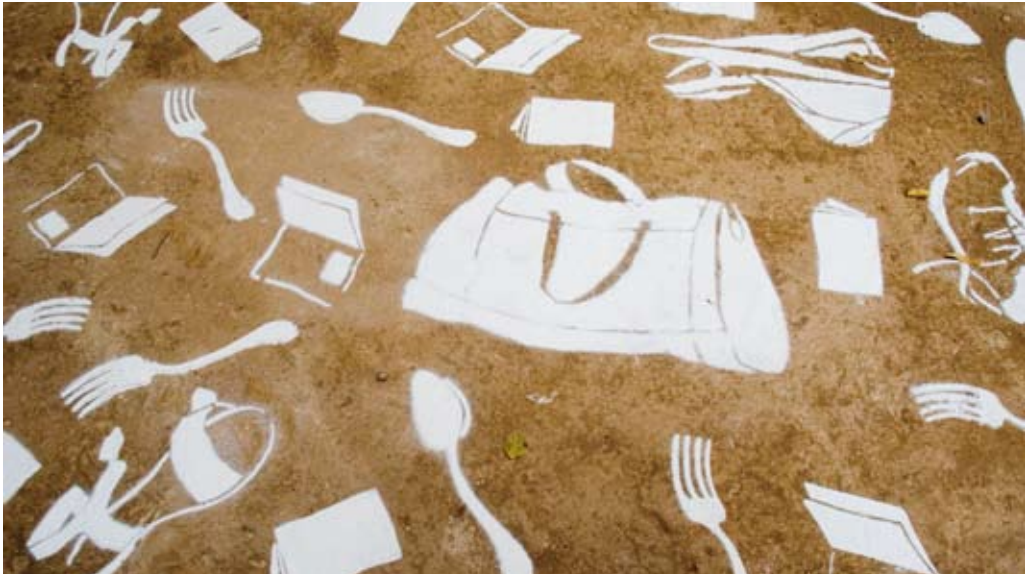
“Buscándose el pan” de Lesley Yendel. El pan representado por la harina forma un camino de siluetas.

parecen relacionarse con el mundo de lo oculto o lo mágico.