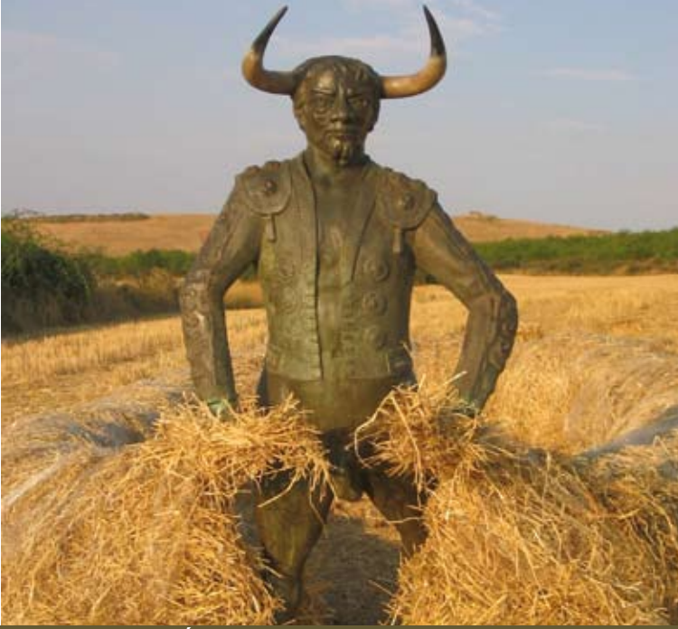
“Minotauro” de Óscar Cenzano refleja la unión entre hombre y bestia en el momento de la trilla.

Son obras sugerentes que invitan a explorar e inventar. Obras que esperan ser descubiertas y redescubiertas de nuevo. Es una vuelta a la naturaleza. Una reflexión que mantiene vivo el contacto entre el hombre y su entorno a través del arte.